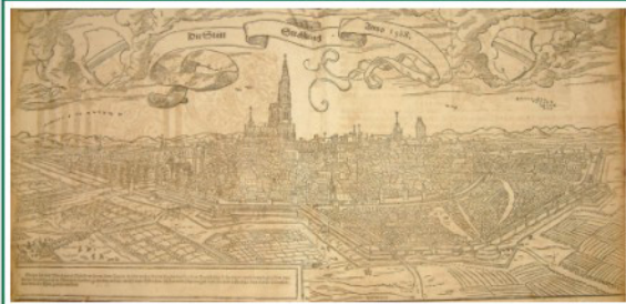
Strasbourg, az a város, ahol megismeri és feleségül veszi Idelette-t.

Kálvin élete sokáig nélkülözi az asszonyi társat. 30 éves, és még agglegény. Feleségét Strasbourgan ismeri meg. Idelette De Bure egy száműzött anabaptista lelkész özvegyeként lesz a felesége. Két évvel idősebb a reformátornál. A hitves kiválasztása hosszadalmas procedúra eredménye - ez ügyben működik egy a korban bevett intézmény is, a „feleség-kereső” bizottság. Kálvin így fogalmazza meg elképzeléseit a bizottság számára: „Az egyedüli szépség, mely engem lebilincsel, a szemérmes, kedves asszony szépsége, aki nem pompakedvelő, hanem takarékos, türelmes, akitől remélhetem, egészségemnek gondját fogja viselni.” Azonban a bizottság javasoltjait rendre elutasítja: egyikük túl gazdag, nem beszél franciául, másikuk túlzottan élénk érzelmekkel viseltetik iránta. Végül, bizottság ide vagy oda, önállóan választ: Idelette-et. Mély egyetértés, tisztelet és szeretet jellemzi a mindössze 9 évig tartó házasságukat. Három gyermekük születik, azonban mindegyikük meghal még csecsemőkorban.